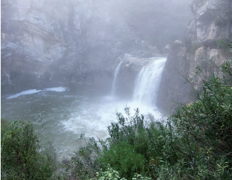
Barranc de L'Encantada - Invierno